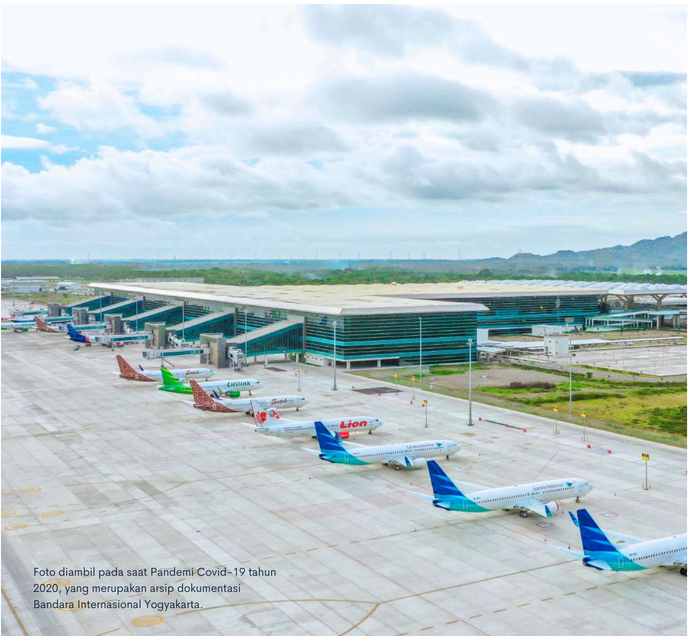
Foto diambil pada saat Pandemi Covid-19 tahun 2020, yang merupakan arsip dokumentasi Bandara Internasional Yogyakarta.